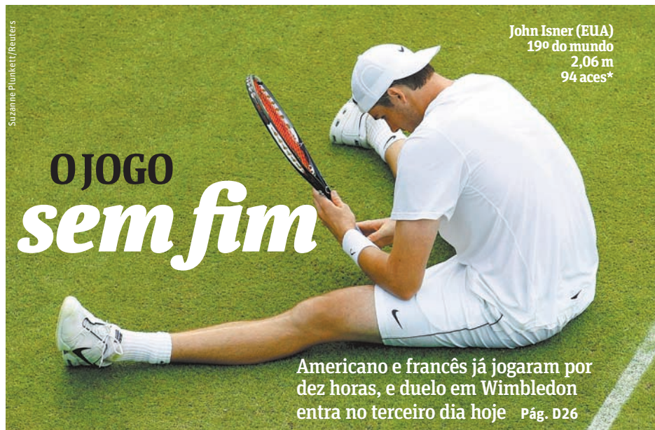
John Isner (EUA) 19º do mundo 2,06 m 94 aces*

Gov. Lula gasta 5 vezes mais com ajuda pós-catástrofe do que com prevenção