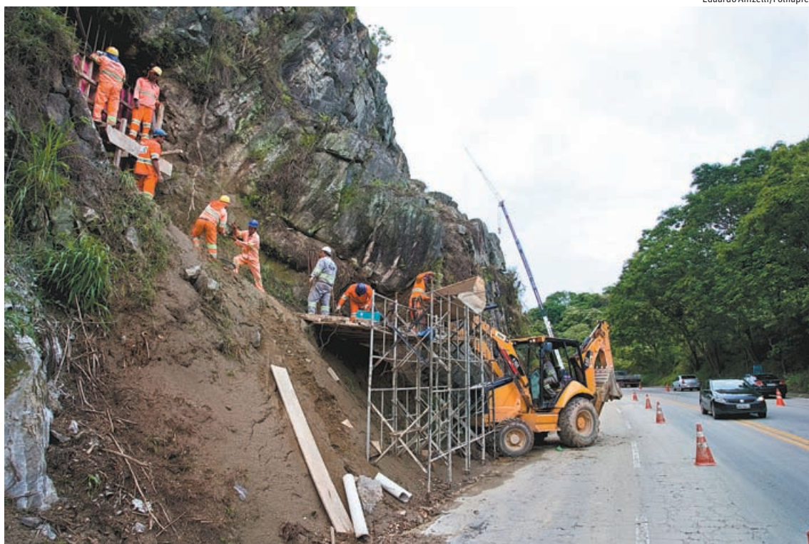
» CORRIDA DE OBSTÁCULOS Homens trabalham em obra na rodovia dos Tamoios, que, ao lado da Régis, está entre as piores opções para ir ao litoral de SP; as melhores são a Mogi-Bertioga e a Rio-Santos entre Guarujá e Ubatuba Pág. C1

O local funciona como uma espécie de entreposto de produtos para sacoleiros de todo o país. Pág. C5