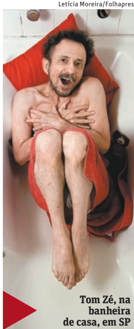
Tom Zé, na banheira de casa, em SP

ILUSTRADA Caixa de Tom Zé traz inéditas com a banda Tortoise Pág. E4