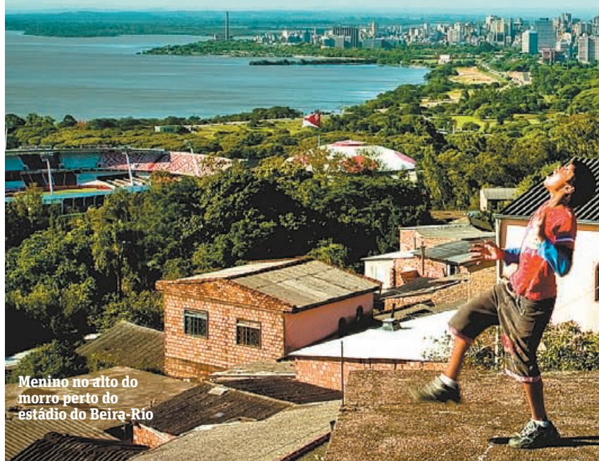
Menino no alto do morro perto do estádio do Beira-Rio

Futebol do país perdeu estilo bonito e eficiência Pág. D3