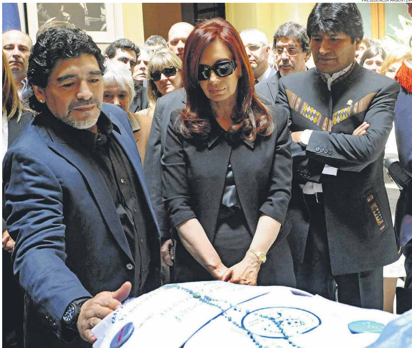
Despedida. Maradona, Cristina Kirchner e Evo Morales no velório do ex-presidente argentino Néstor Kirchner

A decisão do STF está longe de restabelecer a segurança jurídica nos meios políticos. PÁG. A3