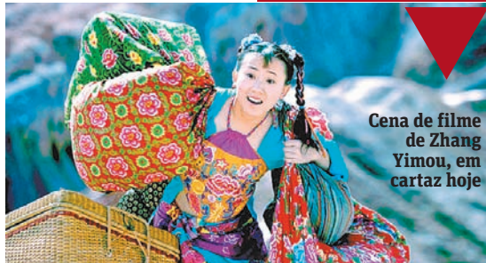
Cena de filme de Zhang Yimou, em cartaz hoje

CIÊNCIA Seca na Amazônia pode ser a mais grave em quatro décadas Pág. 8