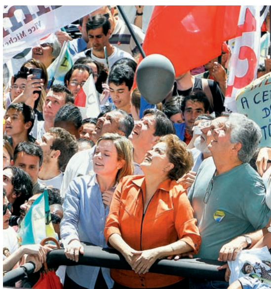
A petista e aliados tentam descobrir de onde veio o balão

ANÁLISE Presidente não está demonstrando bom-senso, escreve Eliane Cantanhêde. Pág. A14