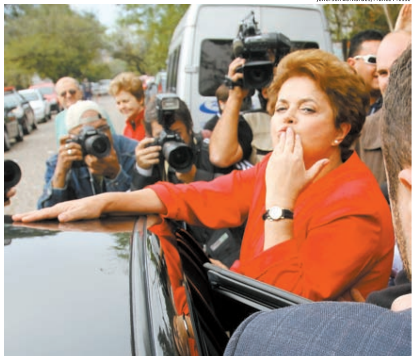
Dilma Rousseff, do PT, manda beijos para simpatizantes depois de votar em Porto Alegre