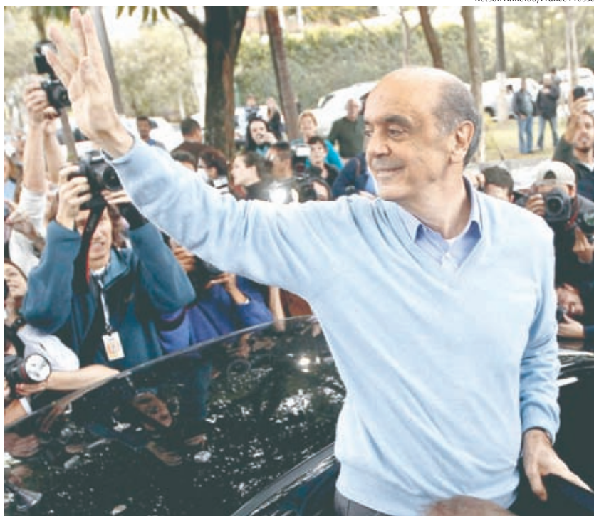
José Serra, do PSDB, acena para os eleitores logo após deixar seção eleitoral em São Paulo

EDIÇÃO NACIONAL ★ CONCLUÍDA ÀS 23H35 ★ R$ 2,50