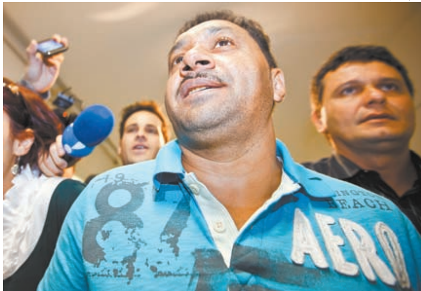
» SEM BRINCADEIRA À paisana, Tiririca (PR) vai a zona eleitoral; humorista foi o mais votado deputado do país em 2010 (1,24 milhão de votos em 92% das urnas) Esp. 1, pág. 13